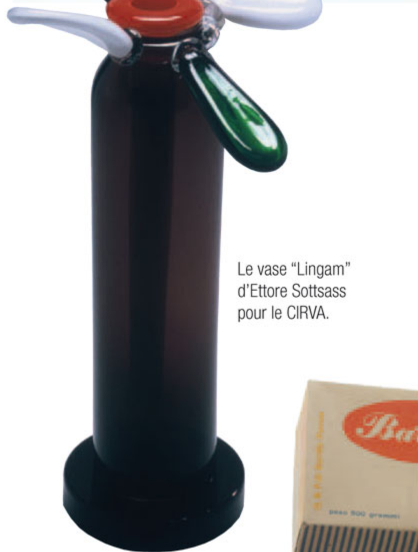
Le vase "Lingam" d'Ettore Sottsass pour le CIRVA.