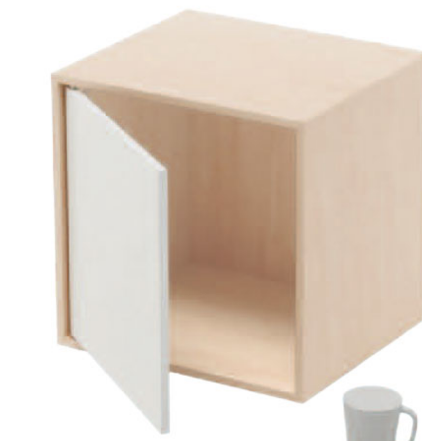
"Object Dependency", design Oki Sato/Nendo, édition galerie Pierre-Alain Challier.

"Object Dependency", Galerie Pierre-Alain Challier, 8 rue Debelleyme, 75003 Paris. Jusqu'au 29 février 2012.