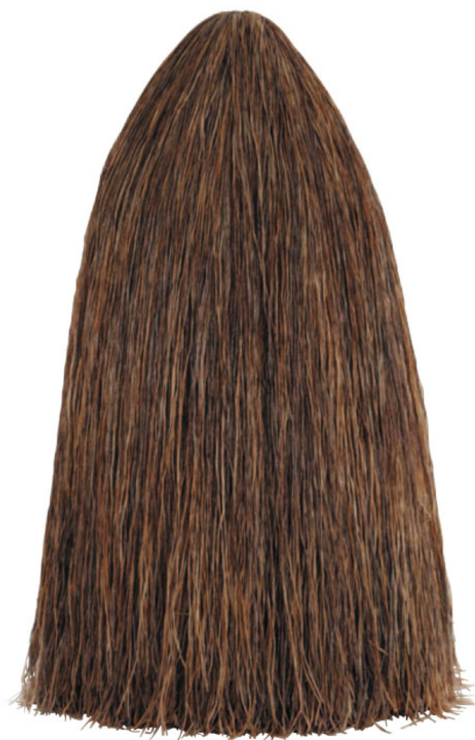
"Cabana", design Humberto et Fernando Campana pour Edra.