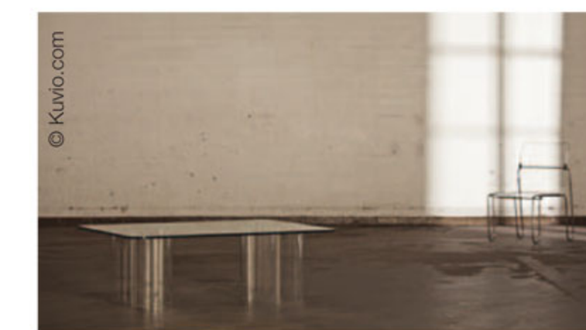
"Phoenix", design Björn Weckström, (1973 pour la table, 1976 pour la chaise).

"Modern Historic. Trésors cachés du design finlandais", Institut Finlandais, 60 rue des Ecoles, 75005 Paris. Du 19 janvier au 25 février 2012.