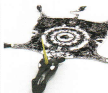
Tapis Peau de licorne , Nicolas Buffe.

licorne de Nicolas Buffe, Triptyque de Benjamin Hochart, La Rivière au bord de l'eau d'Olivier Nottellet. Un second appel à projets pour l'année 2011 est en cours. Montant respectif du prix d'acquisition des trois maquettes primées : grand prix de 45 000 euros, 2 e prix de 20 000 euros et 3 e prix de 10 000 euros. Musée de la tapisserie, avenue des Lissiers, 23200 Aubusson.