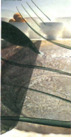
La collection "Day" version acier à 18/10, design Roberto et Ludovica Palomba pour Boes