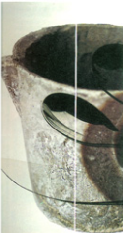
Collection "Lido", contenant en sable et cire, design Marielle Mathieu

L'image du petit cancre sympathique qui dessinait des couverts au revers de ses cahiers est bien ancrée dans l'imaginaire du téléspectateur. La marque poursuit l'exploitation de ce cliché qui donne aux arts de la table une image de convivialité, de complicité, et d'authenticité. Du tout à la coupelle en porcelaine fine, de la batière de casseroles à la tréaire Salern, il n'est pas une collection qui n'apporte son lot de nouveautés et de détails ingénieux. Marche amovible, couvercle verrouillable, manille avec pince à découper, pare-flamme en acier... c'est dans le détail que se retrouve le confort. Guy Degrenne. La dernière collection de couverts "Vanta" décline des formes simples, généralistes, à l'esprit scandinave. Les courbes épousent le gabarit des assiettes et des verres. Une finition polie miroir en acier 18/10.